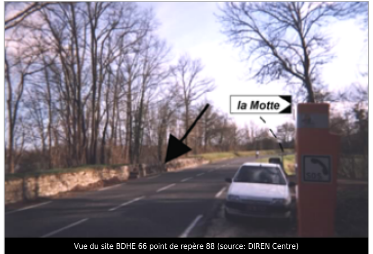
Vue du site BDHE 66 point de repère 88

Coordonnées WGS84 : X: 2.73759837 / Y: 47.61749970