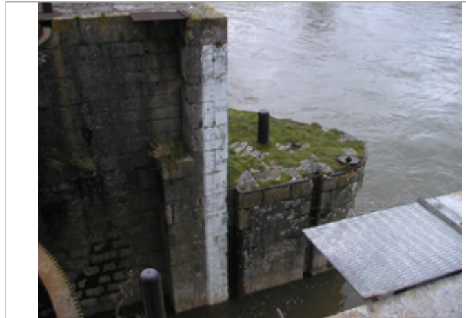
Vue du site BDHE 65 point de repère 86

Coordonnées WGS84 : X: 2.76078811 / Y: 47.59980820