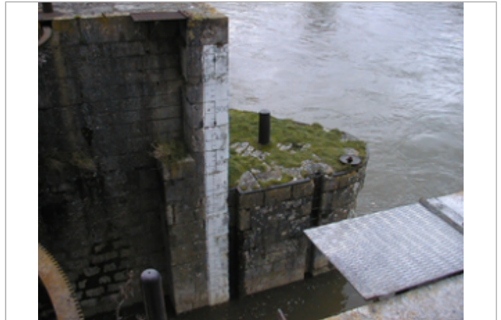
Vue du site BDHE 65 point de repère 86