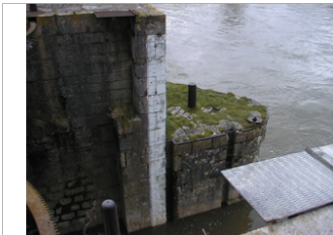
Vue du site BDHE 65 point de repère 86

Coordonnées WGS84 : X: 2.76078811 / Y: 47.59980820