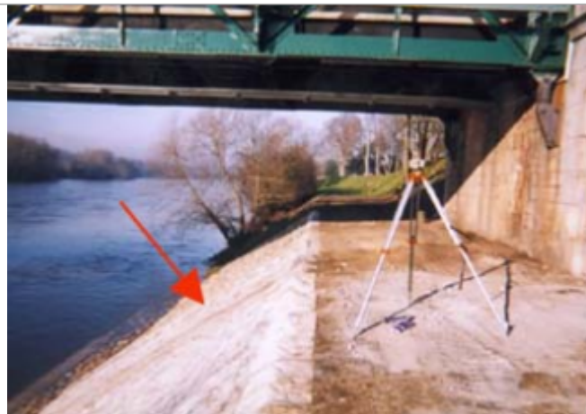
Vue du site BDHE 64 point de repère 84

Coordonnées WGS84 : X: 2.76233540 / Y: 47.59901020