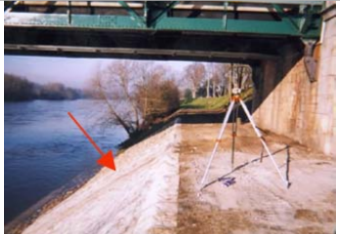
Vue du site BDHE 64 point de repère 84

Coordonnées WGS84 : X: 2.76233540 / Y: 47.59901020