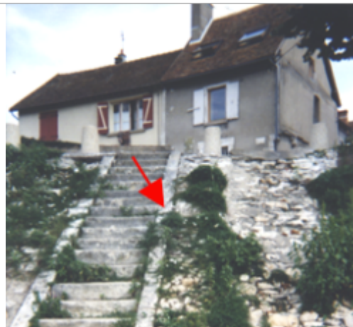
Vue du site BDHE 62 point de repère 81.