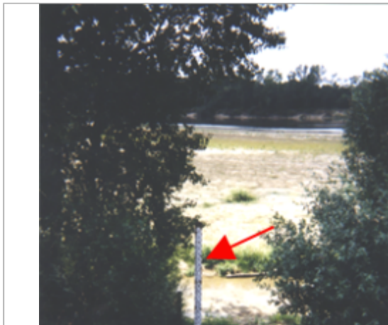
Vue du site BDHE 61 point de repère 79

Coordonnées WGS84 : X: 2.80665084 / Y: 47.58055850