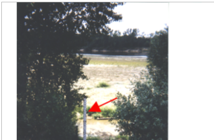
Vue du site BDHE 61 point de repère 79