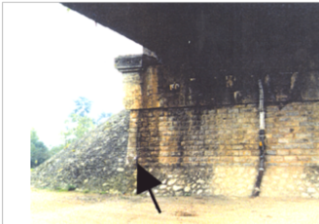
Vue du site BDHE 59 point de repère 76

Coordonnées WGS84 : X: 2.83594407 / Y: 47.55040390