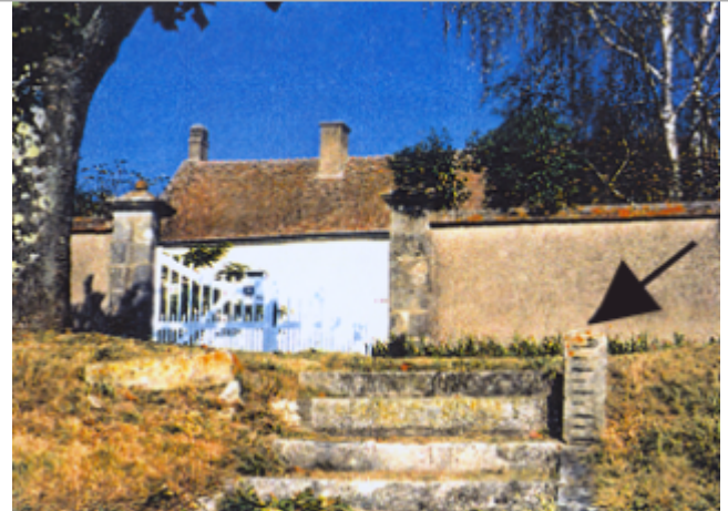
Vue du site BDHE 56 point de repère 71.