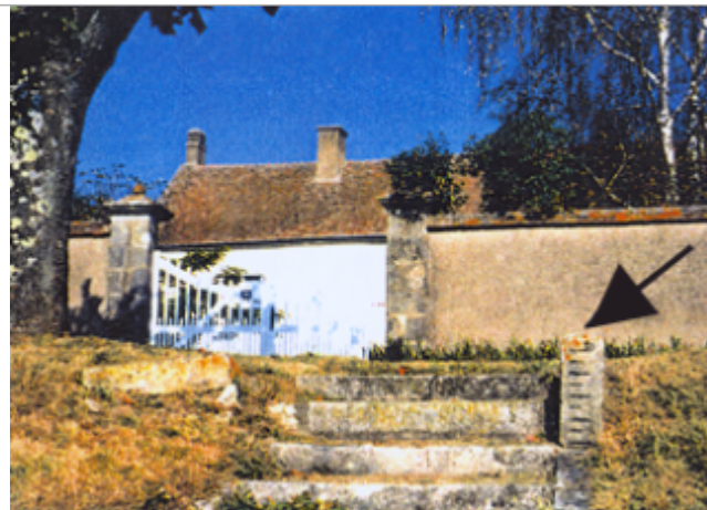
Vue du site BDHE 56 point de repère 71

Coordonnées WGS84 : X: 2.87142758 / Y: 47.52393020