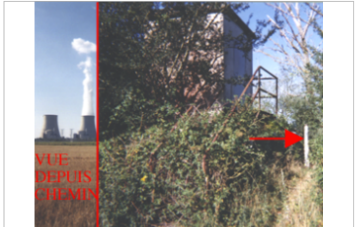
Vue du site BDHE 52 point de repère 66