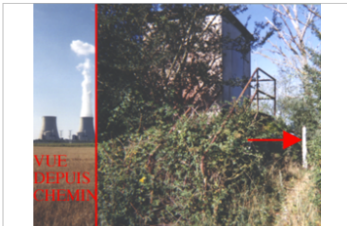
Vue du site BDHE 52 point de repère 66