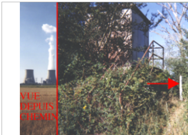
Vue du site BDHE 52 point de repère 66

Coordonnées WGS84 : X: 2.88937091 / Y: 47.49679090