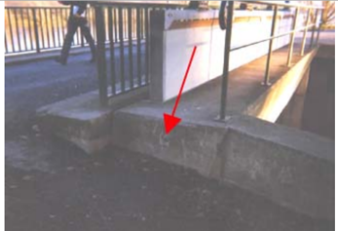
Vue du site BDHE 51 point de repère 64

Coordonnées WGS84 : X: 2.89643562 / Y: 47.48385300