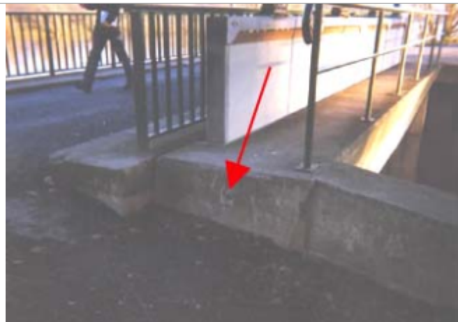
Vue du site BDHE 51 point de repère 64

Coordonnées WGS84 : X: 2.89643562 / Y: 47.48385300