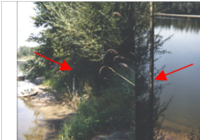
Vue du site BDHE 50 point de repère 61.