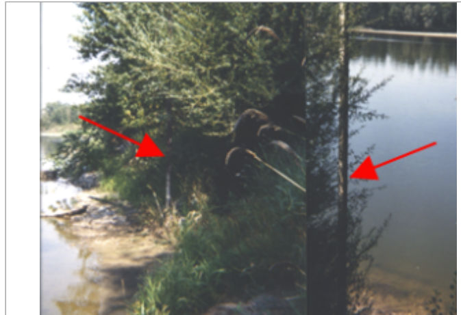
Vue du site BDHE 50 point de repère 61

Coordonnées WGS84 : X: 2.91001912 / Y: 47.47661790