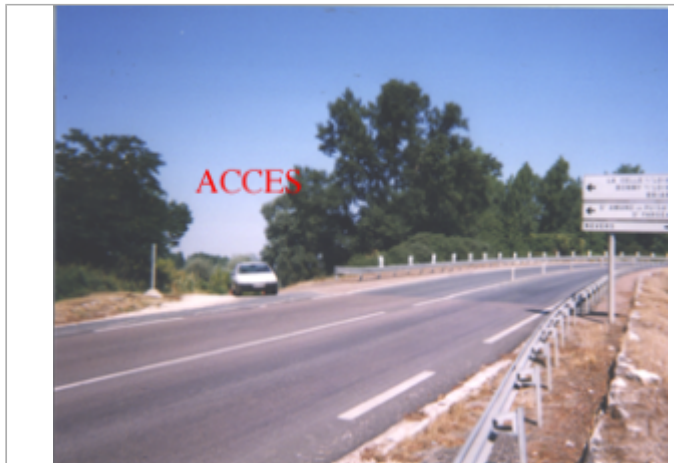
Vue du site BDHE 46 point de repère 57

Coordonnées WGS84 : X: 2.93182448 / Y: 47.44229100