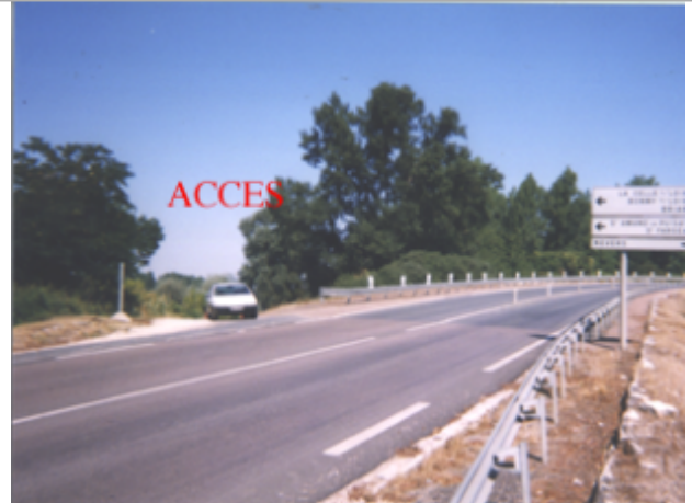
Vue du site BDHE 46 point de repère 57