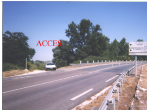
Vue du site BDHE 46 point de repère 57