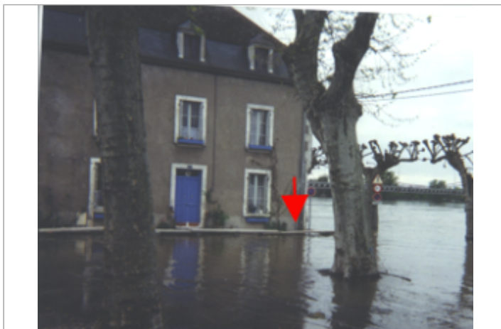
Vue du site BDHE 44 point de repère 55