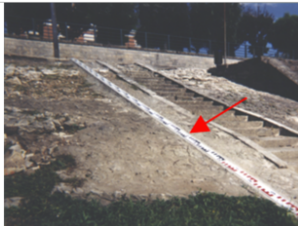
Vue du site BDHE 43 point de repère 53