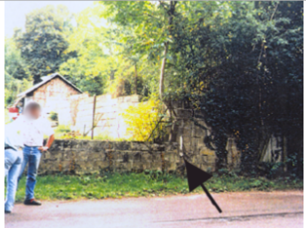
Vue du site BDHE 41 point de repère 51.