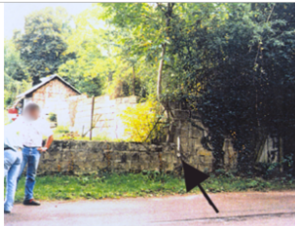
Vue du site BDHE 41 point de repère 51.