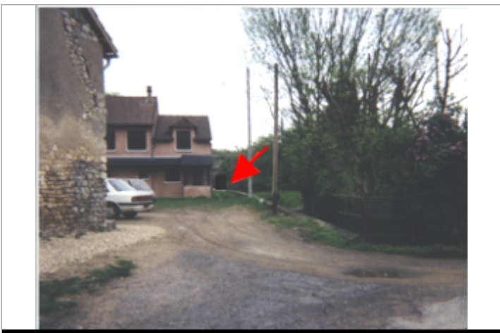
Vue du site BDHE 39 point de repère 48

GÉOLOCALISATION Coordonnées WGS84 : X: 2.89851630 / Y: 47.37397760 Coordonnées RGF93 (Lambert 93) X: 692342 / Y: 6697075.99 Coordonnées RGF93 (ETRS89) : X: 2.8985163 / Y: 47.3739776 Code Hydro: ----0000 Rive de référence: Droite