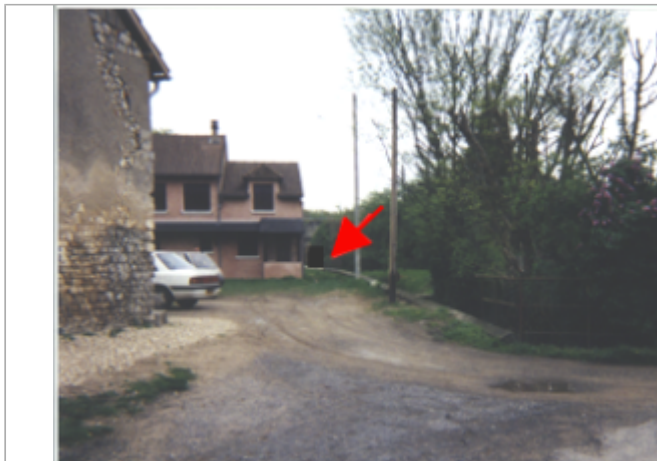
Vue du site BDHE 39 point de repère 48

Coordonnées WGS84 : X: 2.89851630 / Y: 47.37397760