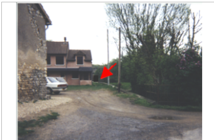
Vue du site BDHE 39 point de repère 48