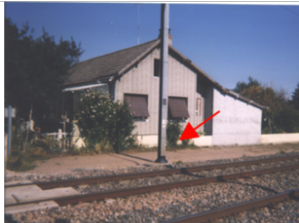
Vue du site BDHE 38 point de repère 46

Coordonnées WGS84 : X: 2.89052115 / Y: 47.36305080