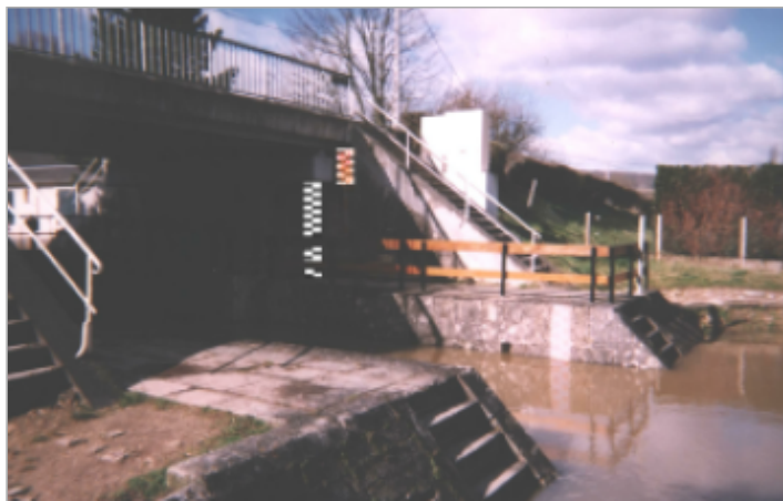
Vue du site BDHE 37 point de repère 45 (source: DIREN Centre)