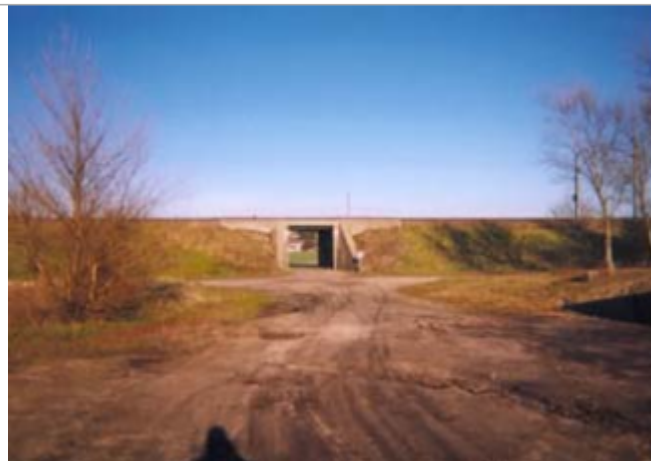
Vue du site BDHE 35 point de repère 43