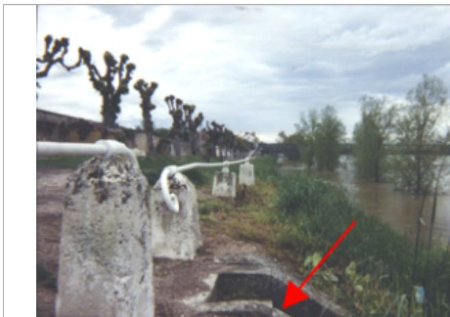
Vue du site BDHE 31 point de repère 39