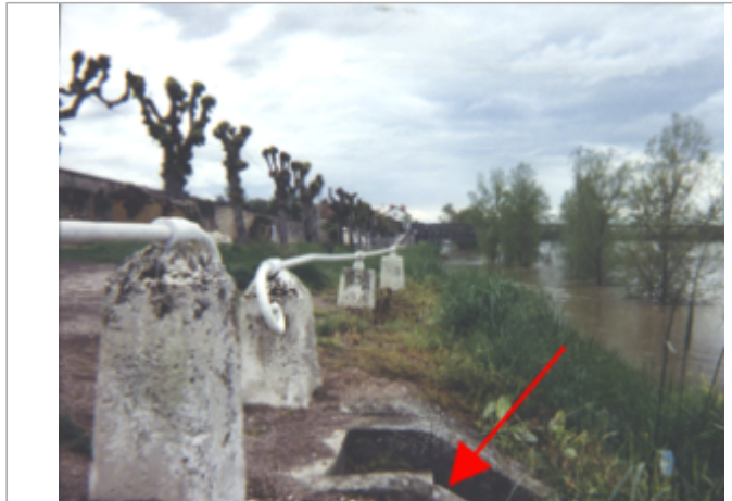
Vue du site BDHE 31 point de repère 39

Coordonnées WGS84 : X: 2.95537835 / Y: 47.28107370