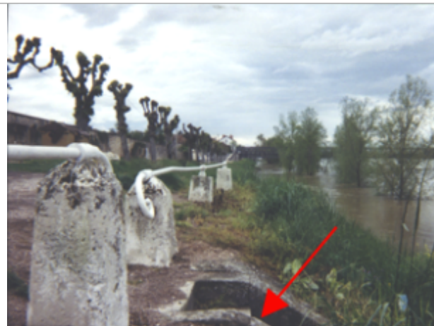
Vue du site BDHE 31 point de repère 39