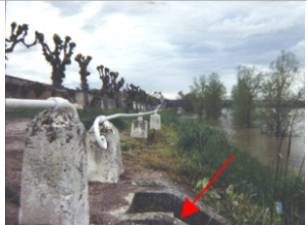
Vue du site BDHE 31 point de repère 39