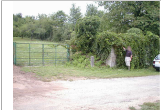
Vue du site BDHE 29 point de repère 36