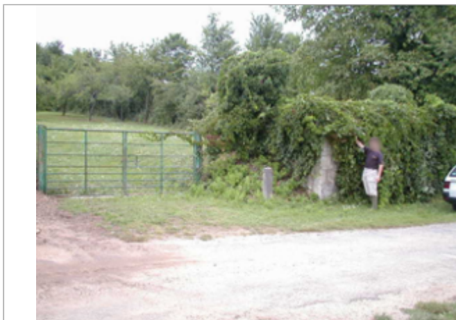
Vue du site BDHE 29 point de repère 36