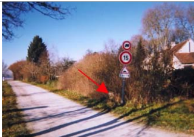
Vue du site BDHE 28 point de repère 35