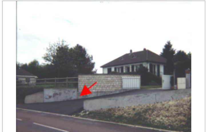
Vue du site BDHE 27 point de repère 34 (source: DIREN Centre)