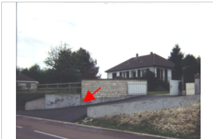
Vue du site BDHE 27 point de repère 34

Coordonnées WGS84 : X: 2.98017523 / Y: 47.26588430