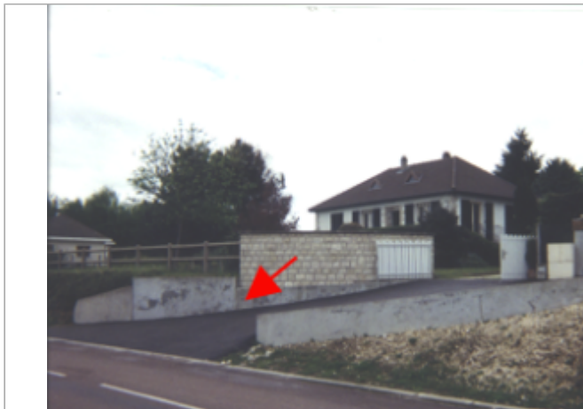
Vue du site BDHE 27 point de repère 34

Coordonnées WGS84 : X: 2.98017523 / Y: 47.26588430