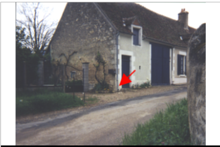
Vue du site BDHE 26 point de repère 33

GÉOLOCALISATION Coordonnées WGS84 : X: 2.98745445 / Y: 47.24319890 Coordonnées RGF93 (Lambert 93) X: 699051 / Y: 6682543.99 Coordonnées RGF93 (ETRS89) : X: 2.9874545 / Y: 47.2431989 Code Hydro: ----0000 Rive de référence: Droite