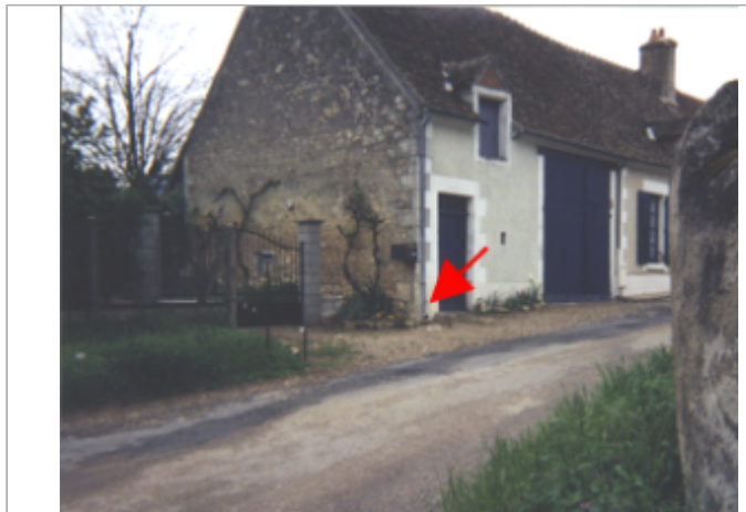
Vue du site BDHE 26 point de repère 33

Coordonnées WGS84 : X: 2.98745445 / Y: 47.24319890