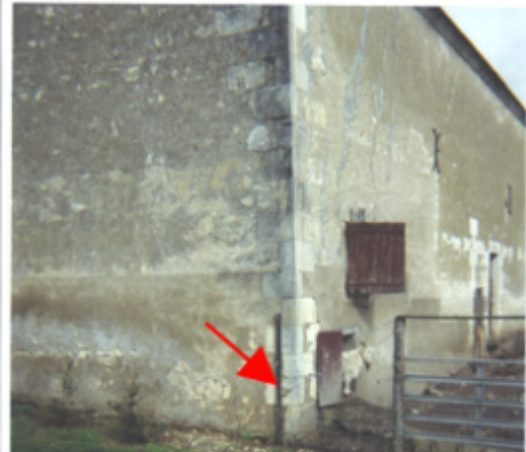
Vue du site BDHE 25 point de repère 32

Coordonnées WGS84 : X: 2.97578098 / Y: 47.24415130