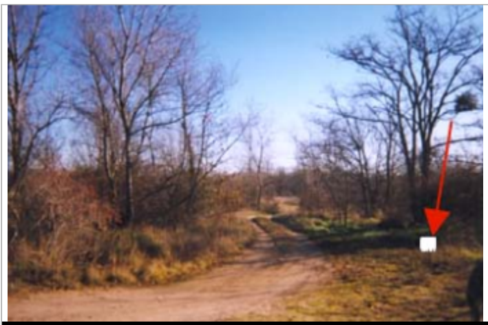
Vue du site BDHE 24 point de repère 29

GÉOLOCALISATION Coordonnées WGS84 : X: 2.98309424 / Y: 47.23587920 Coordonnées RGF93 (Lambert 93) X: 698721 / Y: 6681730.99 Coordonnées RGF93 (ETRS89) : X: 2.9830942 / Y: 47.2358792 Code Hydro: ----0000 Rive de référence: Droite