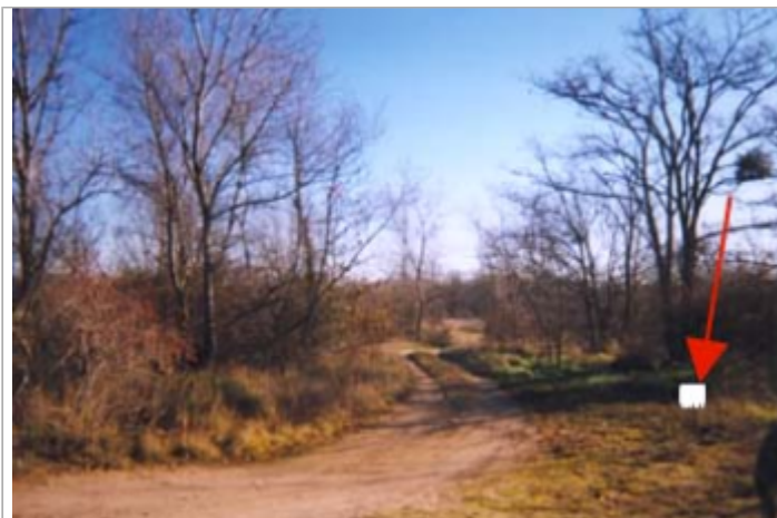
Vue du site BDHE 24 point de repère 29