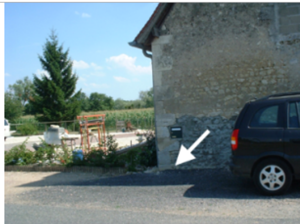
Vue du site BDHE 22 point de repère 26