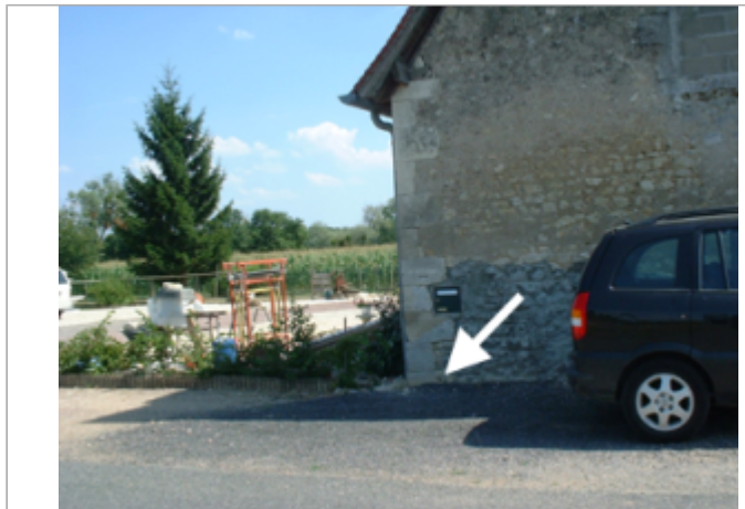
Vue du site BDHE 22 point de repère 26

Coordonnées WGS84 : X: 2.98988081 / Y: 47.20522590