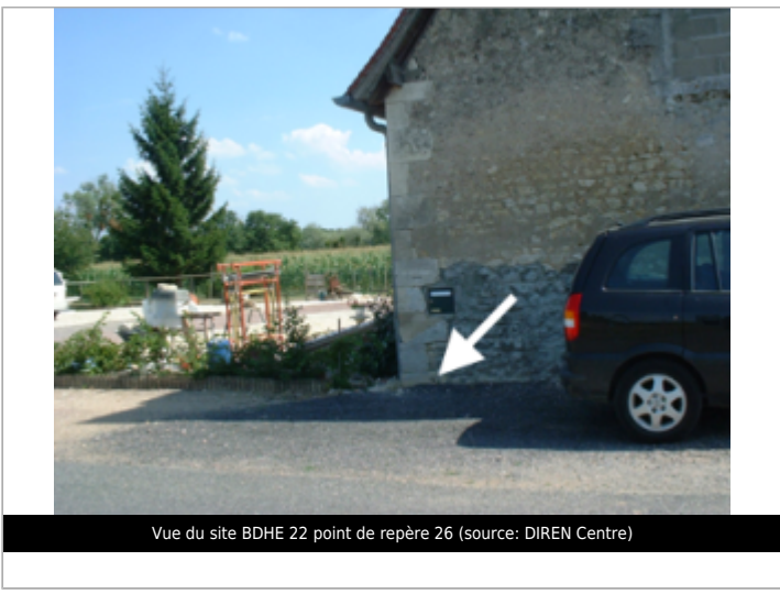
Vue du site BDHE 22 point de repère 26

GÉOLOCALISATION Coordonnées WGS84 : X: 2.98988081 / Y: 47.20522590 Coordonnées RGF93 (Lambert 93) X: 699234 / Y: 6678326 Coordonnées RGF93 (ETRS89) : X: 2.9898808 / Y: 47.2052259 Code Hydro: ----0000 Rive de référence: Gauche