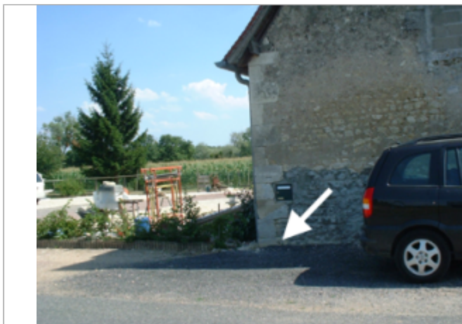
Vue du site BDHE 22 point de repère 26

Coordonnées WGS84 : X: 2.98988081 / Y: 47.20522590