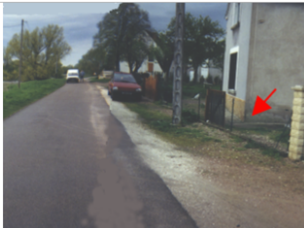
Vue du site BDHE 21 point de repère 25

Coordonnées WGS84 : X: 2.99545645 / Y: 47.19522420