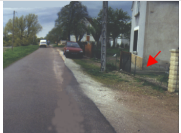
Vue du site BDHE 21 point de repère 25

Coordonnées WGS84 : X: 2.99545645 / Y: 47.19522420