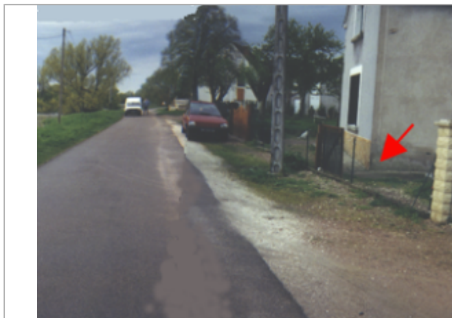
Vue du site BDHE 21 point de repère 25

Coordonnées WGS84 : X: 2.99545645 / Y: 47.19522420