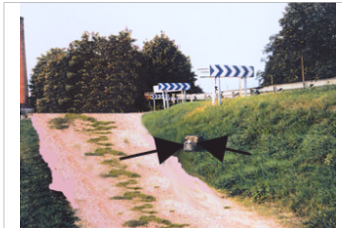
Vue du site BDHE 20 point de repère 24