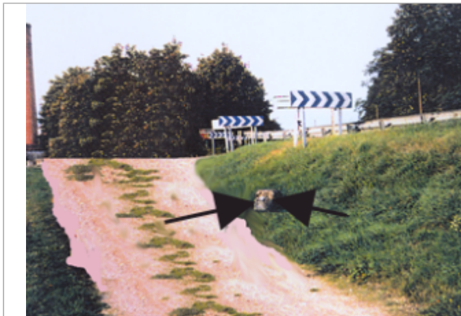
Vue du site BDHE 20 point de repère 24

Coordonnées WGS84 : X: 3.00978578 / Y: 47.18796760